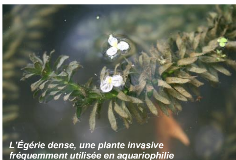
L'Égérie dense, une plante invasive fréquemment utilisée en aquariophilie

Chacun peut agir et contribuer à ne pas répandre ces végétaux, en adoptant dès maintenant de bonnes pratiques !