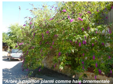
Arbre à papillon planté comme haie ornementale

Une plante invasive est une plante exotique (introduite volontairement ou non dans une aire étrangère à son milieu d'origine), qui prolifère dans un espace naturel au détriment de la biodiversité locale qu'elle peut complètement éliminer. Sa présence et son introduction peuvent également avoir des impacts sur la santé publique et l'économie.